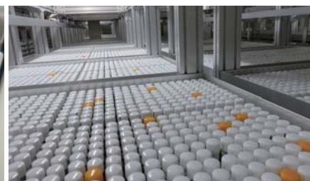
粉末化合物自動倉庫 Powder compounds strage system (TSUBAKIMOTO CHAIN)