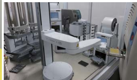
フルオートメーション超微量非接触分注システム A-pod, Echo555 (Agilent Technologies, LABCYTE)