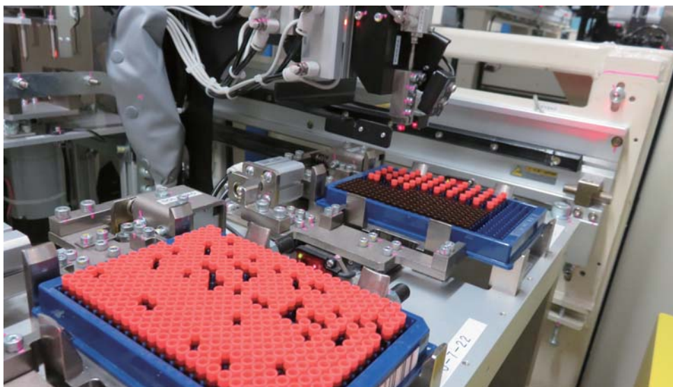
溶液化合物自動倉庫 384tube strage system (TSUBAKIMOTO CHAIN)